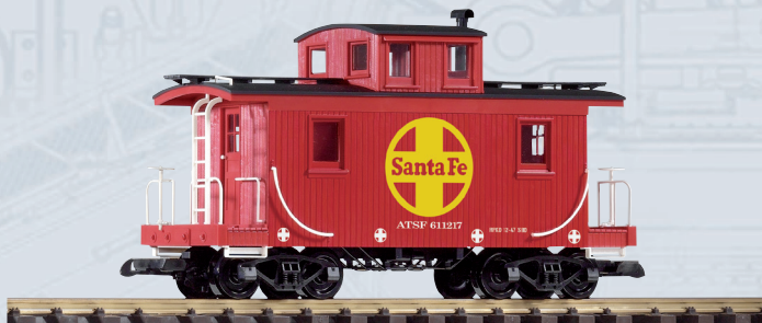
38896 Carro di accompagnamento per treno Santa Fè