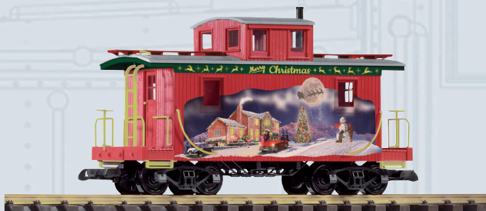
38897 Carro di accompagnamento per treno Natalizio