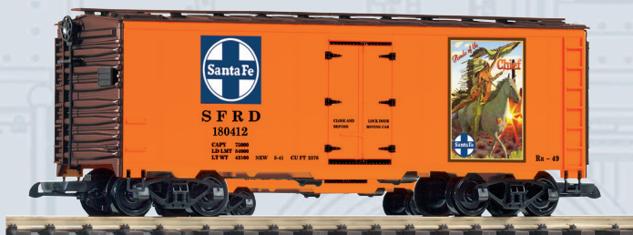
38895 Carro refrigerante Santa Fè „Warrior Chief“