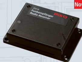
35018 G ricevitore radio 2,4GHz

I componenti digitali # 35017 Navigator 2.4GHz e # 35018 ricevitore radio da 2,4 GHz sostituiscono gli articoli n. 35011 e n. 35012. Ulteriori informazioni sono disponibili su www.piko.de .