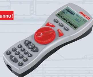
35017 G Navigator 2,4GHz