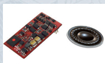
46445 PIKO SmartDecoder 4.1 Sound per TT Locomotiva elettrica Vectron BR 193

Il PIKO SmartDecoder 4.1 Sound è un decoder digitale universale di ultima generazione con audio a 8 canali e 12 bit, più uscite luminose e un controllo motore da 1,2 A. Gestisce i formati di dati DCC con Rail-ComPlus®, Motorola® e Selectrix®, è compatibile con mfx e può essere utilizzato anche su sistemi analogici. L'altoparlante incluso è adattato in modo specifico alle rispettive Locomotiva.