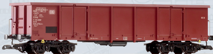
37743 Carro aperto a carrelli tipo Eaos delle DB, Ep. IV

Con il modello da giardino della BR 118 a 4 assi della Deutsche Reichsbahn, PIKO sta ancora una volta esaudendo il desiderio di numerosi fans di modelli da giardino e appassionati di locomotive Diesel grandi e attraenti. Il modello della BR 118 nella dimensione della scala G ha tutto l'aspetto esteriore della locomotiva reale. Il modello fine e robusto convince per la sua affidabilità, con il set di ruote cromate, cuscinetti a sfera, cambi delle luci in base alla direzione, illuminazione della cabina, una replica della sala macchine e della cabina di guida con figura del macchinista. Degni di nota sono anche i numerosi dettagli individuali come i corrimani, i tergicristalli, alcune parti del carrello e la griglia di ventilazione del tetto finemente incisa. Il modello è preparato per il funzionamento digitale con il Sound. Il dispositivo per i due evaporatori a impulsi per le tipiche nubi di scarico di entrambi i motori e un evaporatore per la caldaia, nonché un'illuminazione della sala macchine, può essere facilmente montato. Un treno espresso DR come l'originale, può essere riprodotto fedelmente con il modello PIKO della BR 118 a 4 assi con le carrozze della Reichsbahn Rekowagen 37650-37652. Coloro che preferiscono un treno merci molto impressionante possono usare i carri silos per cemento PIKO 37792.