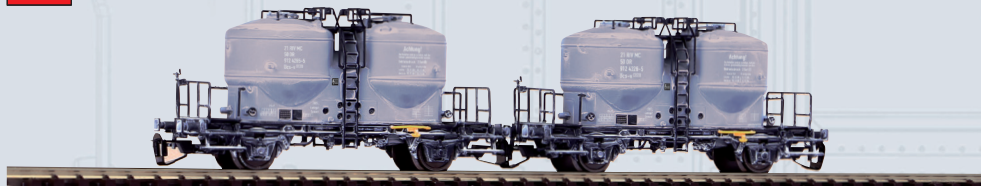
47030 Carri silos per cemento delle DR, Ep. IV, Set 2 carri