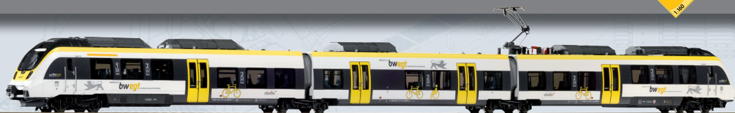
40207 Elettrotreno BR 442 „Talent 2 - Baden-Württemberg Design“ Abellio, Ep. VI