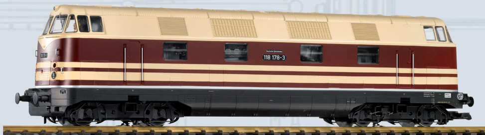
37575 Locomotiva Diesel BR 118 DR, Ep. IV, quattro assi

Con il modello da giardino della BR 118 a 4 assi della Deutsche Reichsbahn, PIKO sta ancora una volta esaudendo il desiderio di numerosi fans di modelli da giardino e appassionati di locomotive Diesel grandi e attraenti. Il modello della BR 118 nella dimensione della scala G ha tutto l'aspetto esteriore della locomotiva reale. Il modello fine e robusto convince per la sua affidabilità, con il set di ruote cromate, cuscinetti a sfera, cambi delle luci in base alla direzione, illuminazione della cabina, una replica della sala macchine e della cabina di guida con figura del macchinista. Degni di nota sono anche i numerosi dettagli individuali come i corrimani, i tergicristalli, alcune parti del carrello e la griglia di ventilazione del tetto finemente incisa. Il modello è preparato per il funzionamento digitale con il Sound. Il dispositivo per i due evaporatori a impulsi per le tipiche nubi di scarico di entrambi i motori e un evaporatore per la caldaia, nonché un'illuminazione della sala macchine, può essere facilmente montato. Un treno espresso DR come l'originale, può essere riprodotto fedelmente con il modello PIKO della BR 118 a 4 assi con le carrozze della Reichsbahn Rekowagen 37650-37652. Coloro che preferiscono un treno merci molto impressionante possono usare i carri silos per cemento PIKO 37792.