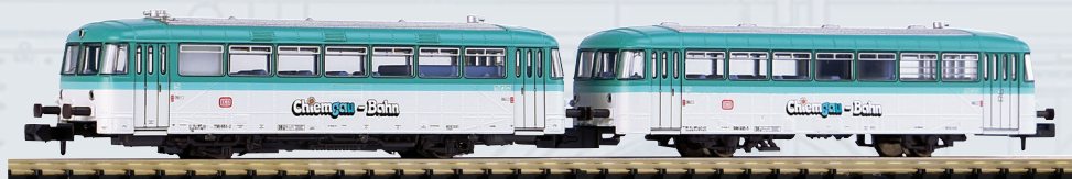
40253 Automotrice Diesel BR 798 con rimorchiata Chiemgau-Bahn Ep. IV-V

Con la locomotiva a vapore BR 82 delle Ferrovie Federali Tedesche, PIKO continua la sua serie di modelli ottimamente dettagliati in scala 1: 160. Il modello PIKO, realizzato con nuovi stampi, colpisce per la perfetta verniciatura e la stampa molto nitida. Per enfatizzare il nostro modello ci sono ancora molti dettagli: il fischio della locomotiva, le scalette, le condotte parzialmente autoportanti e le condotte di protezione del pistone. Il modello PIKO della BR 82 ha la luce bianco/bianco commutabile digitalmente a seconda della direzione di marcia e dotata di un'interfaccia Next18. Il modello con telaio in zinco pressofuso ha un motore potente per eccellenti caratteristiche di guida e di trazione.