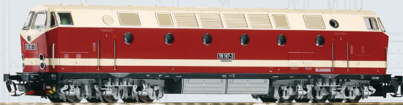
47345 Locomotiva Diesel BR 119 delle DR Ep. IV, faro con direzione verso il basso / Sound