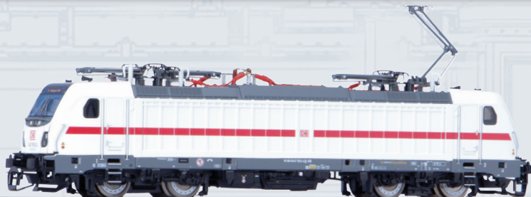
47454 Locomotiva elettrica BR 147.5 delle DB AG IC Ep. VI