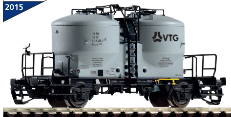
47750 Zementsilowagen Ucs-v VTG DB AG Ep. V