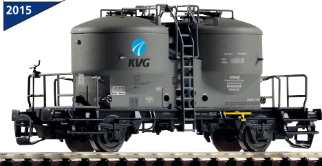
47751 Zementsilowagen Ucs-v KVG DB AG Ep. V