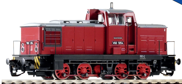
47360 Diesellok V 60.10 DR Ep. III