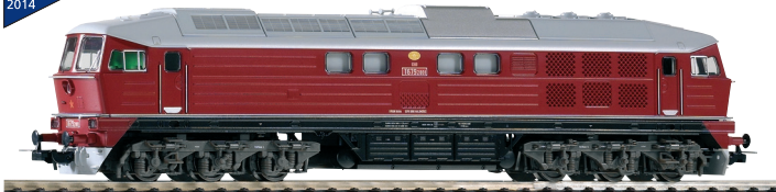
59750 Diesellok T 679.2 ČSD Ep. IV, mit kleinen Seitenfenstern 109,99 €* * unverbindlich empfohlener Verkaufspreis