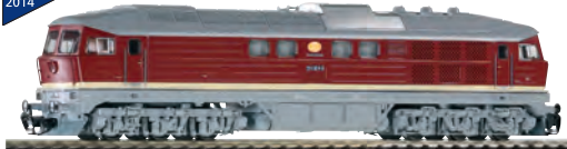
47321 Diesellokomotive BR 131 DR Ep. IV 99,99 €* FORM NEU 2014