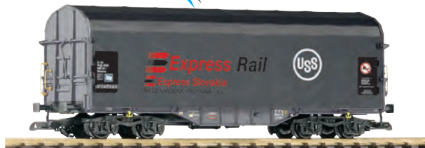
37729 Shimmns 723 Express Rail SK Ep. VI