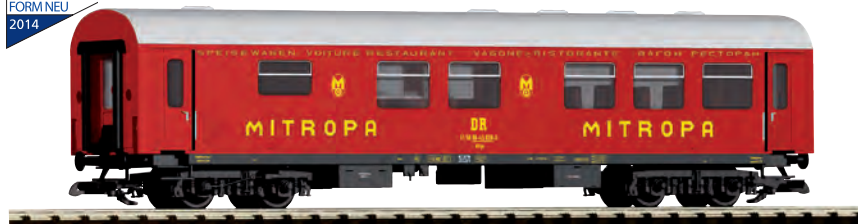
37652 Reko-Speisewagen „Mitropa“ DR Ep. IV

170,00 €* Abbildung: colorierte CAD Zeichnung