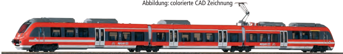
47243 3-tlg. Elektrotriebwagen BR 442 „VVO“ DB AG Ep. VI

170,00 €* Abbildung: colorierte CAD Zeichnung