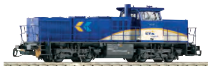
47226 Diesellok G 1206 evb Ep. VI 94,99 €* FORM NEU 2014